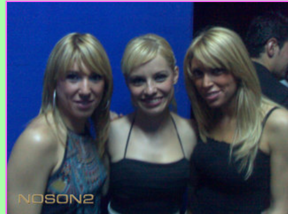
Una chica sin novio, una que le caben 3 y otra que fue a Eurovisión y quedó la última

3) Venus: Es el grupo revelación desde hace meses, TANTOS meses que ya se han quedado antiguas. No sacan disco ni nuevos temas, por lo que es de suponer que lo único que buscan en el mundo de la música es comerla. Hay que ver lo fácil que lo tenemos los maricas, que si queremos comerla con ir a los baños de la Fnac está el tema resuelto, no nos vemos obligados a formar girlbands. Prometo que si algún día Venus sacan disco, les haré una campaña de marketing tan sólo comparable a la que le hago a Anamor. Modo publicidad ON ** (¡¡Anamor saca disco este otoño!! ¡Incluye un dueto con Marta Sánchez! ¡Todos a comprarlo!) **Modo publicidad OFF